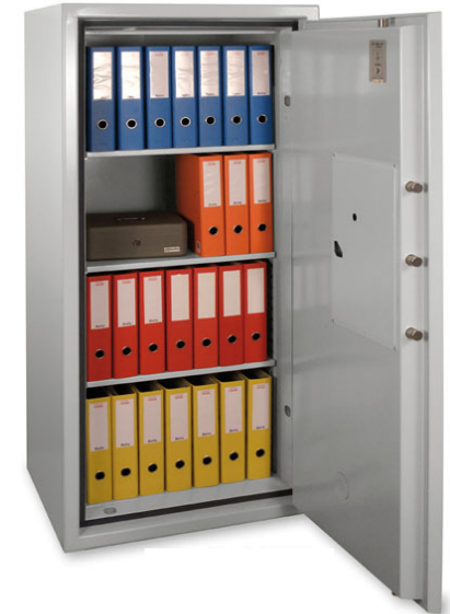
PaperGard 160 E