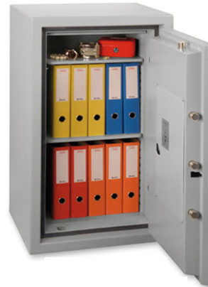
PaperGard 100 E