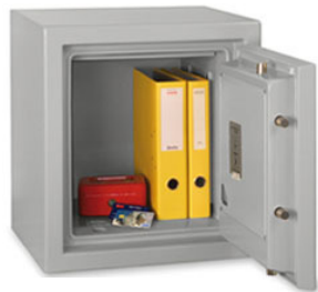
PaperGard 60 E

Geprüfte Sicherheit gegen Feuer mit hohem Preis-/Leistungsverhältnis.