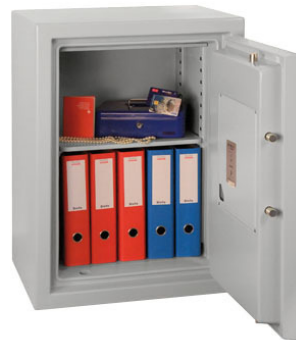
PaperGard 80 E