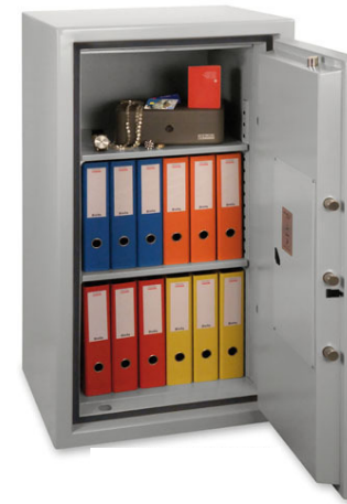
PaperGard 120 E