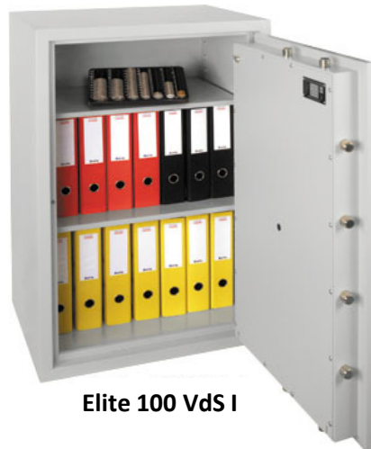
Elite 100 VdS I