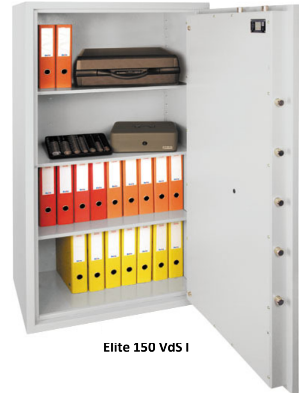
Elite 150 VdS I