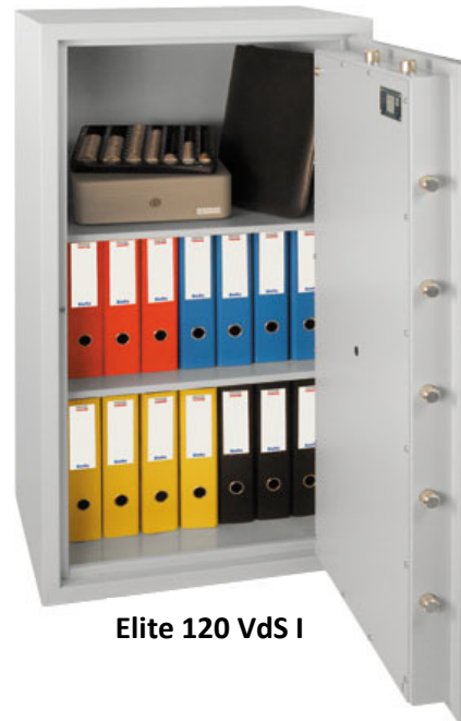
Elite 120 VdS I