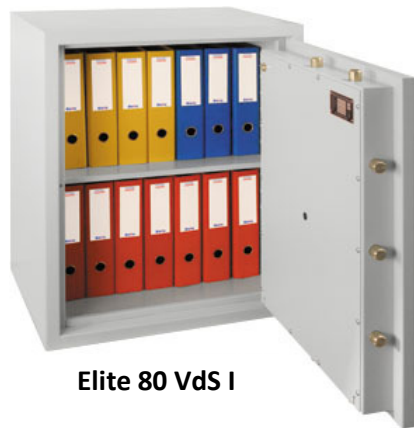
Elite 80 VdS I

Beste Sicherheit für Bares und Dokumente