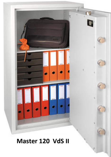
Master 120 VdS II