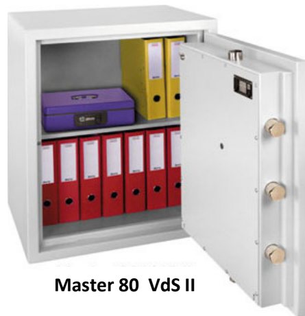
Master 80 VdS II