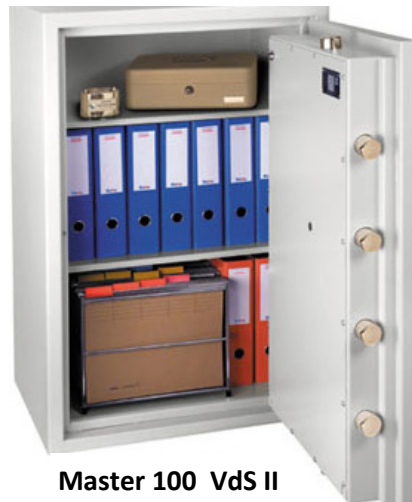
Master 100 VdS II