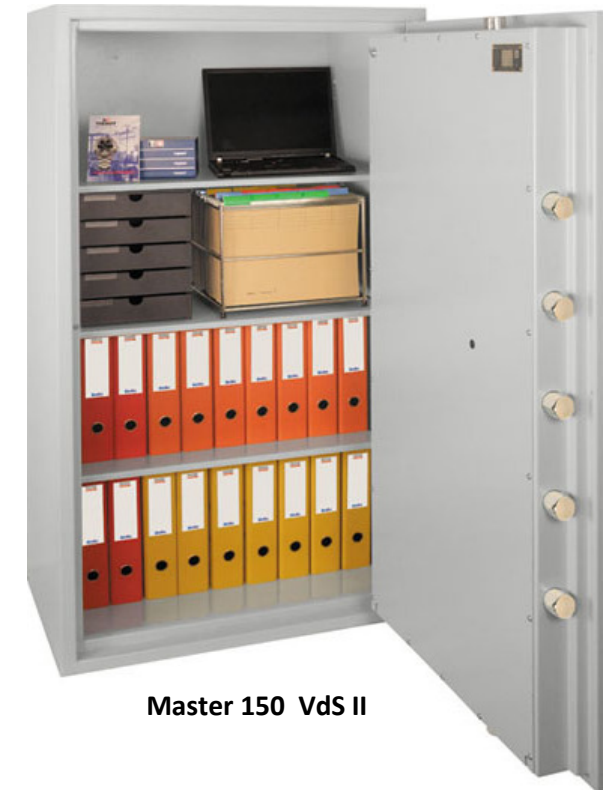
Master 150 VdS II